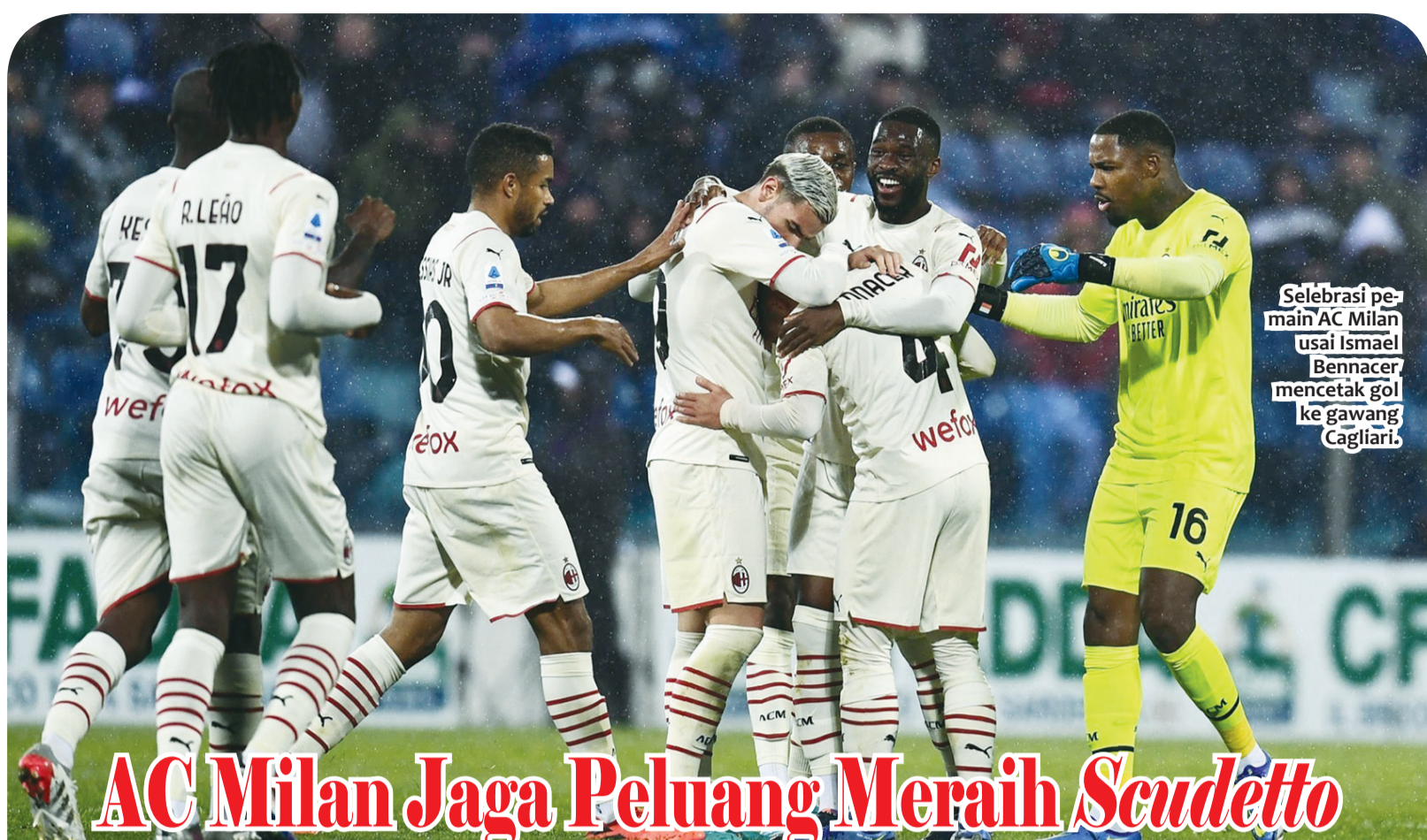
Selebrasi pemain AC Milan usai Ismael Bennacer mencetak gol ke gawang Cagliari.