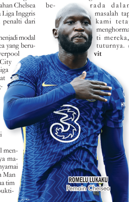
ROMELU LUKAKU Pemain Chelsea

Tuchel pun tak mau Lukaku dan kolega terlena dengan torehan saat ini. Ia bakal tetap mendorong anak asuhannya untuk tampil lebih baik lagi. "Kami tidak akan pernah mengakui apa pun sebelum semuanya diputuskan. Kami akan selalu mendorong diri kami sendiri tetapi kami tidak boleh terbawa suasana. Tim-tim ini mengambil keuntungan saat kami berada dalam masalah tapi kami tetap menghormati mereka," tuturnya. ● vit