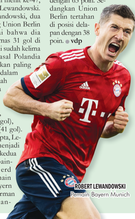
ROBERT LEWANDOWSKI Pemain Bayern Munich

Tambahan tiga poin membuat Die Roten kokoh di puncak klasemen sementara dengan 63 poin. Sedangkan Union Berlin tertahan di posisi delapan dengan 38 poin. ● vdp